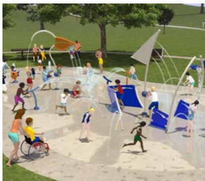
Рисунок 4 – Детская площадка, предложенная жителями в г. Лудингтоне (штат Мичиган, США)

Еще один пример создания онлайн-портала со множеством проектов, на которые собираются средства в семи штатах США, является объединение «Общественные пространства – территории местных сообществ» (англ. - Public Spaces Community Places ). 43 Оно создано с помощью усилий горожан и Мичиганской корпорации экономического развития (англ. – The Michigan Economic Development Corporation ). На данном портале – платформе собран ряд проектов, которые нуждаются в финансовой поддержке. Проекты предлагают сами горожане, например, детская водная площадка (см. рисунок 4) 44 , организация подходов к реке Flint river и др.