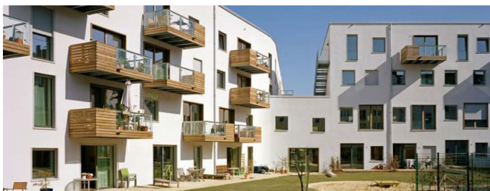
Рисунок 5 – Проект «Открытый дом» в Гамбурге (Германия)

Еще одной формой самоорганизации является объединение граждан с целью строительства жилья. Примером такой самоорганизации может служить проект «Открытый дом» в Гамбурге. 46 В результате проекта было создано 44 новых жилых объектов на свободной территории берега канала Эрнста-Августа (см. рисунок 5).