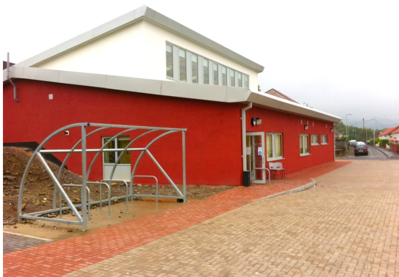
Рисунок 2 – Реконструкция центра сообщества в Глинкоче (Уэльс, Великобритания)

Одним из примеров реализации проекта с использованием краудфандинговой платформы является реконструкция центра сообщества в Глинкоче – деревне с населением 2589 человек в Уэльсе (см. рисунок 2). 42